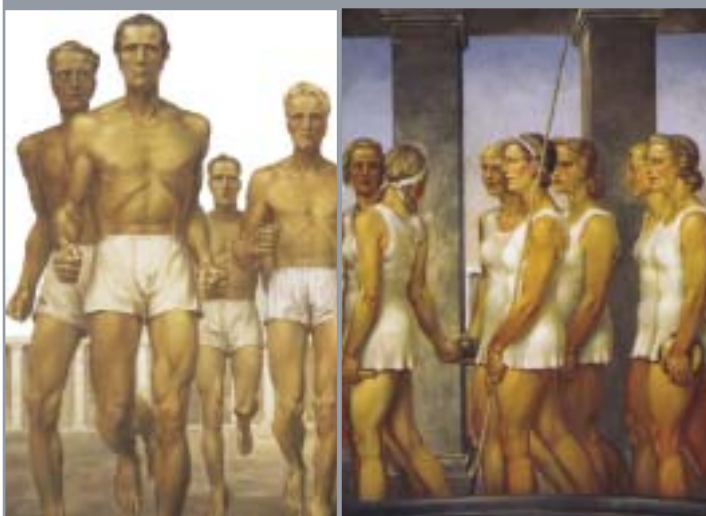
Le modèle aryen