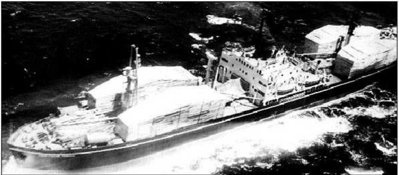
Cargo soviétique transportant des missiles SS4 à ogive nucléaire.

On repère également 26 navires soviétiques transportant des ogives nucléaires (opérationnelles en 10 jours) en route vers l'île.