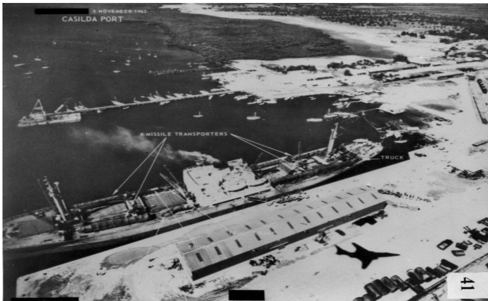
Navire russe remportant des missiles..

Finalement, la solution vient de concessions faites à la fois par les Russes et par les Américains: chacun promet de fermer un site de missiles. Les Russes fermeront celui de Cuba, les Américains fermeront une base de missiles de type « Jupiter » en Turquie.