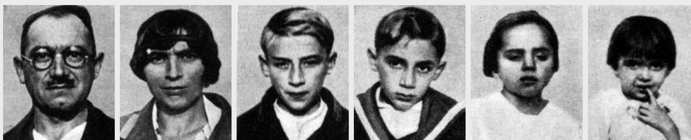
III. 5 « Famille tzigane » : photographies illustrant un article de Guido Landra et censées « prouver l'infériorité des Tsiganes ». (d'après Boursier 1999, p. 16)

vie en dépit d'une foule d'obstacles posés par des lois et règlements qui finiront par les plonger dans la tragédie de la seconde guerre mondiale.